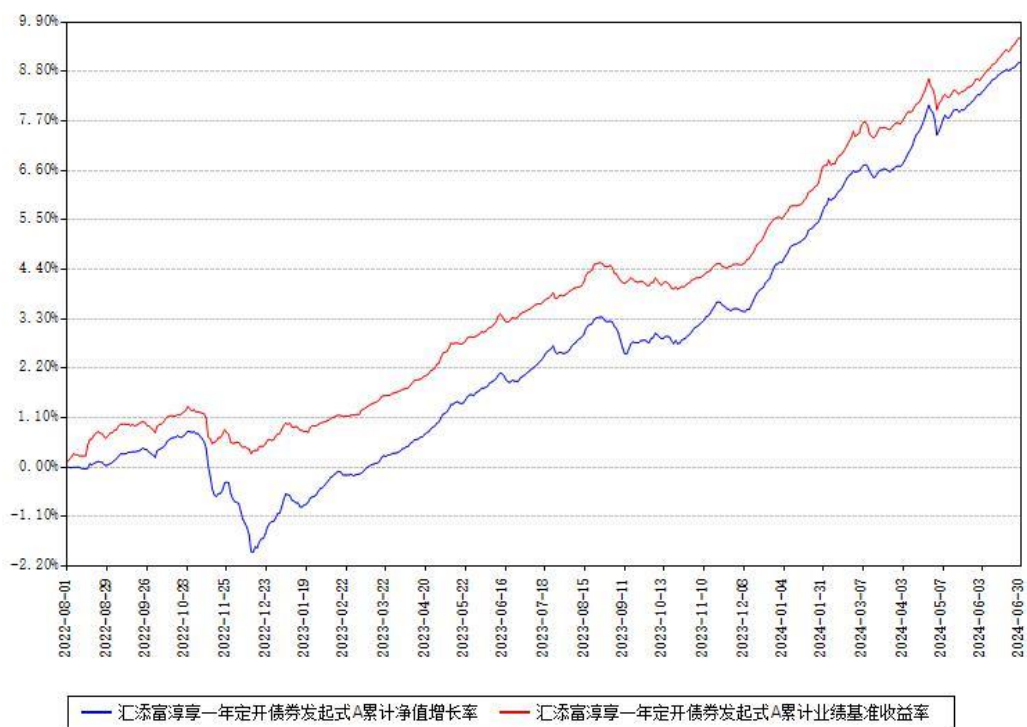
汇添富淳享一年定开债券发起式A累计净值增长率与同期业绩基准收益率对比图