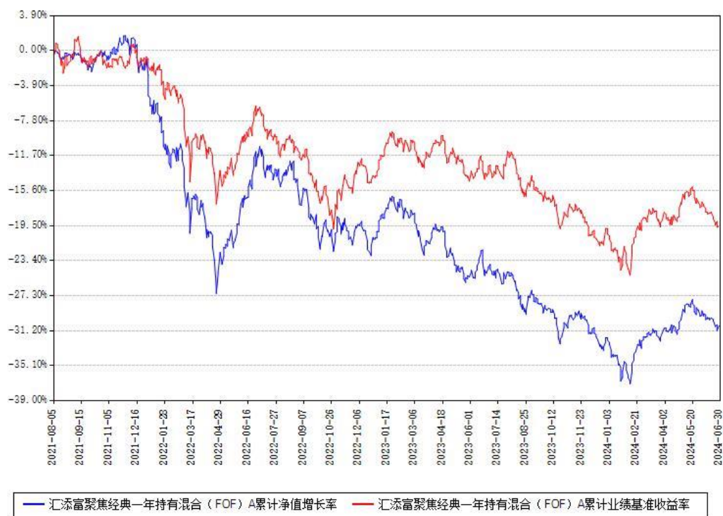
汇添富聚焦经典一年持有混合（FOF）A累计净值增长率与同期业绩基准收益率对比图

（二）自基金合同生效以来基金累计净值增长率变动及其与同期业绩比较基准收益率变动的比较图