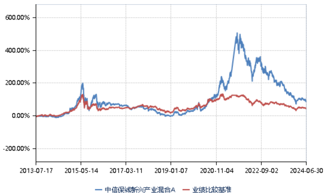
中信保诚新兴产业混合 C