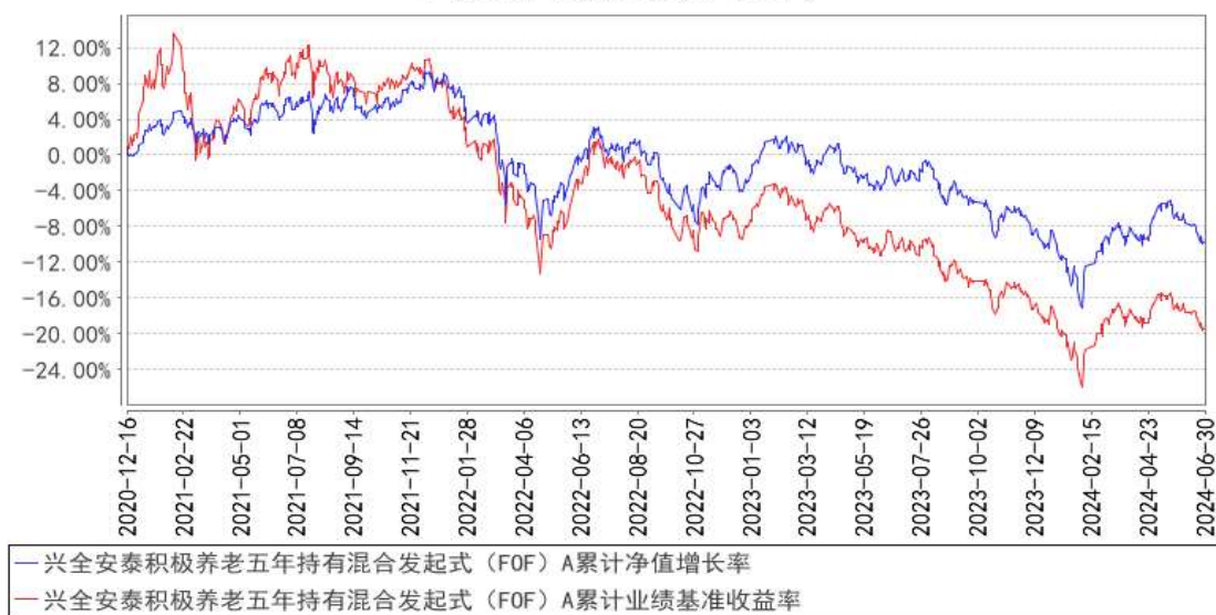
兴全安泰积极养老五年持有混合发起式（FOF）A累计净值增长率与同期业绩比较基准收益率的历史走势对比图