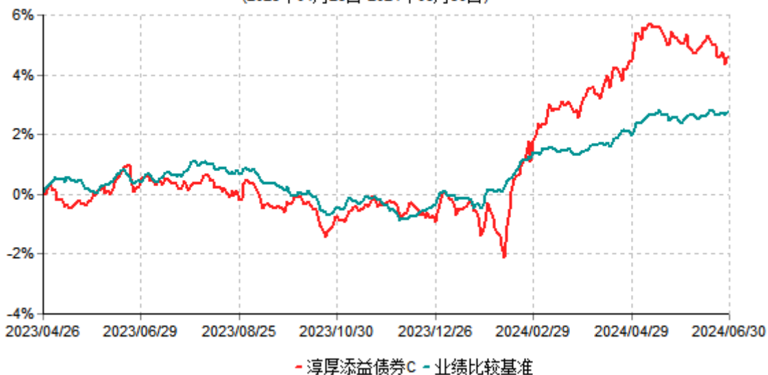
淳厚添益债券C累计净值增长率与业绩比较基准收益率历史走势对比图 (2023年04月26日-2024年06月30日)

注：本基金基金合同生效日为 2023 年 4 月 26 日。按基金合同规定，本基金自基金合同生效起 6 个月内为建仓期。建仓期结束时本基金的各项投资比例均符合基金合同约定。