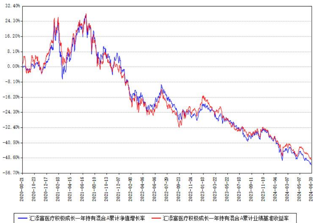
汇添富医疗积极成长一年持有混合A累计净值增长率与同期业绩基准收益率对比图