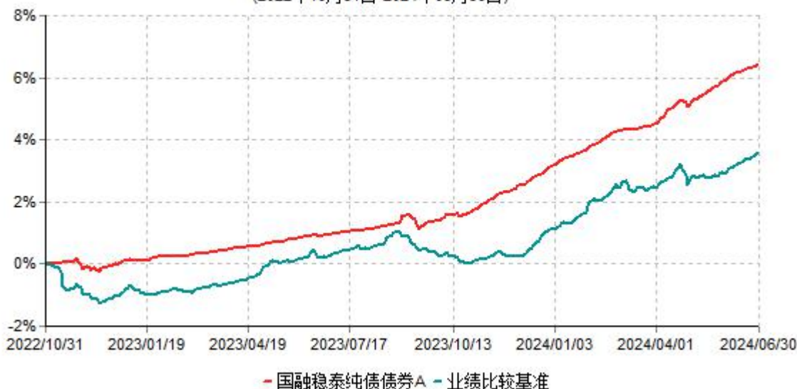
国融稳泰纯债债券A累计净值增长率与业绩比较基准收益率历史走势对比图 (2022年10月31日-2024年06月30日)