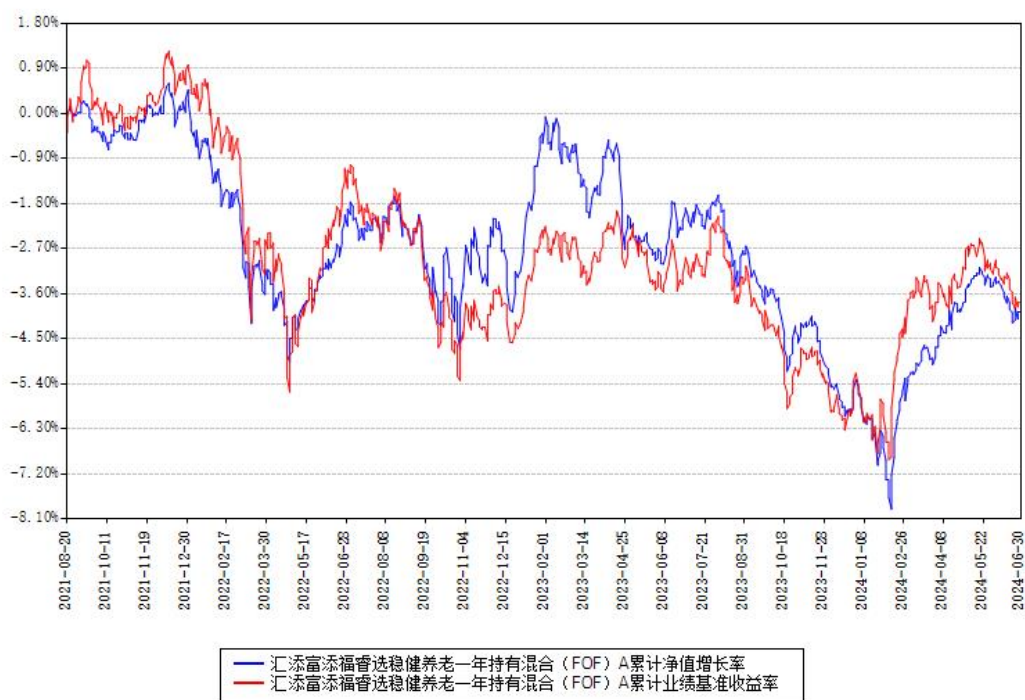
汇添富添福睿选稳健养老一年持有混合（FOF）A累计净值增长率与同期业绩比较基准收益率对比图