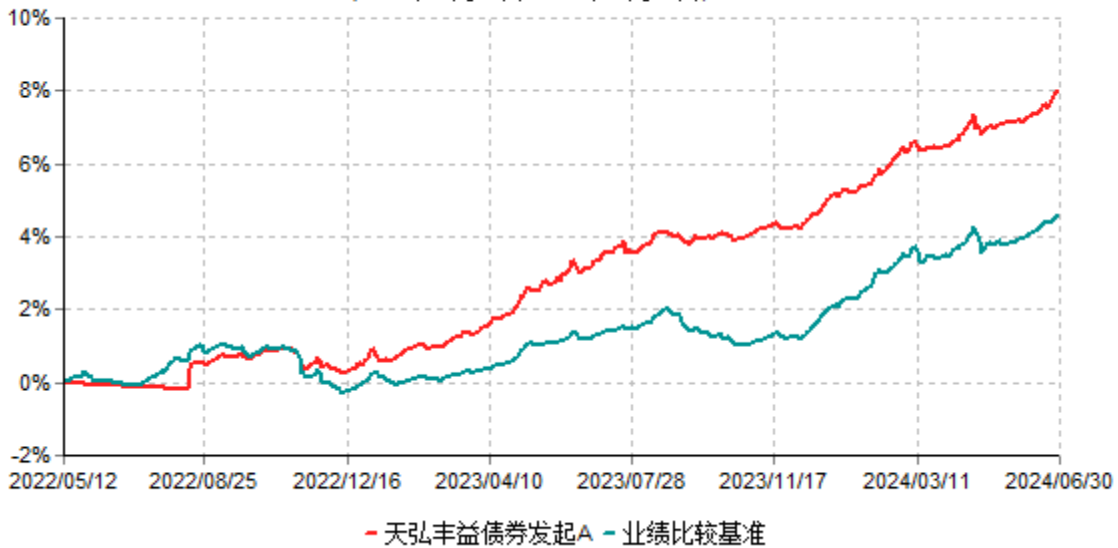
天弘丰益债券发起A累计净值增长率与业绩比较基准收益率历史走势对比图 (2022年05月12日-2024年06月30日)