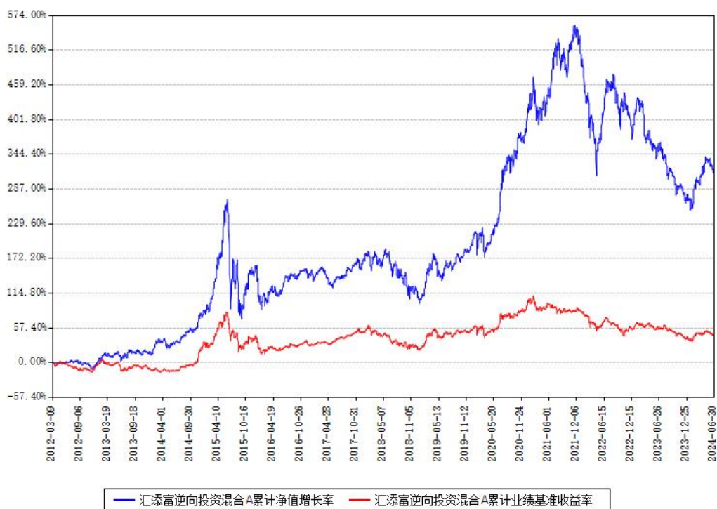
汇添富逆向投资混合A累计净值增长率与同期业绩基准收益率对比图