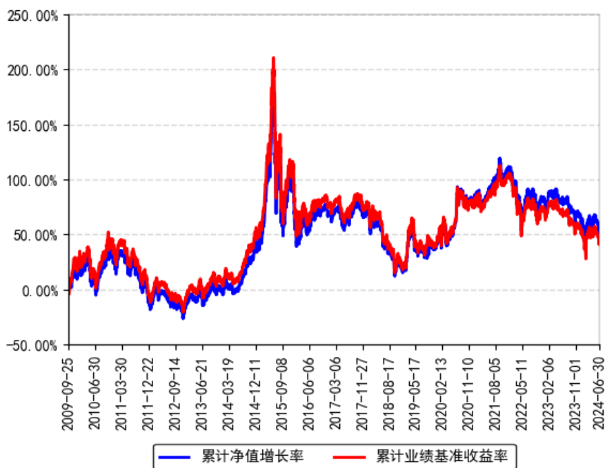
南方中证500ETF联接 (LOF) A 累计净值增长率与同期业绩比较基准收益率的历史走势对比图