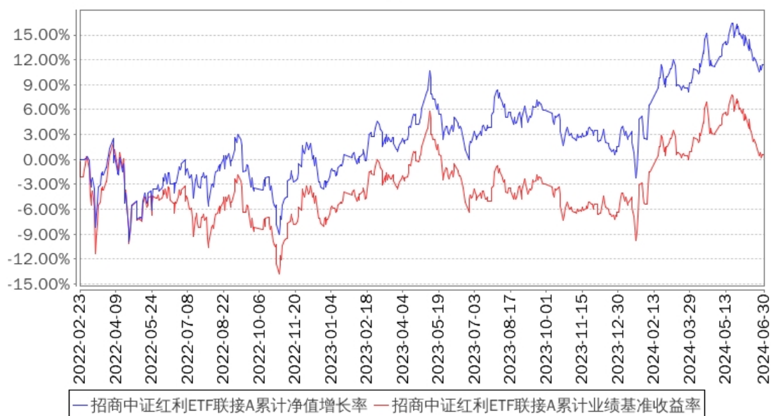
招商中证红利ETF联接A累计净值增长率与同期业绩比较基准收益率的历史走势对比图