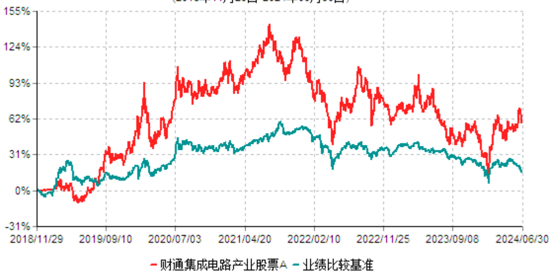
财通集成电路产业股票A累计净值增长率与业绩比较基准收益率历史走势对比图 (2018年11月29日-2024年06月30日)