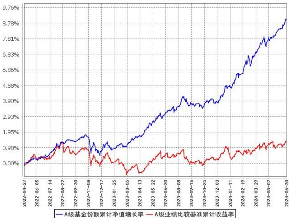
A级基金份额累计净值增长率与同期业绩比较基准收益率的历史走势对比图 (2022年4月27日至2024年6月30日)