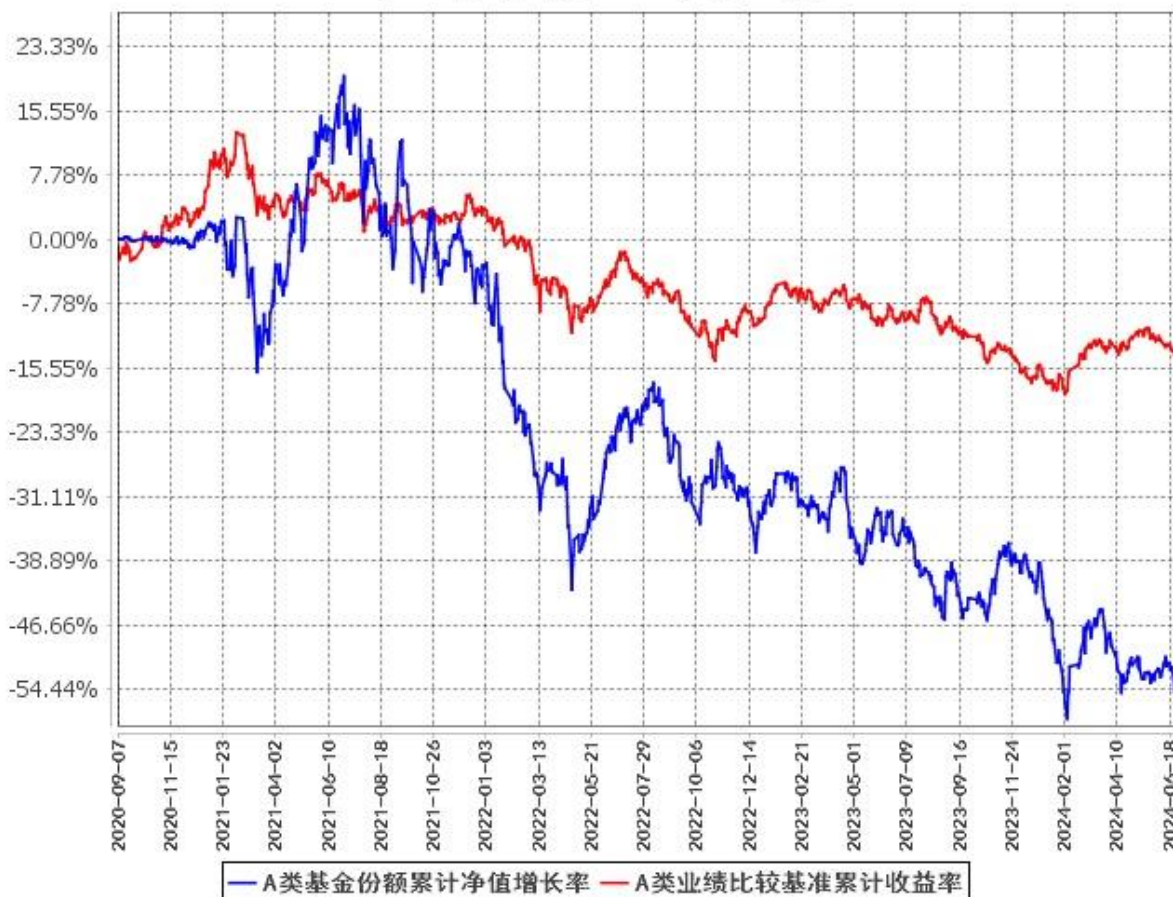
A类基金份额累计净值增长率与同期业绩比较基准收益率的历史走势对比图 (2020年9月7日至2024年6月30日)