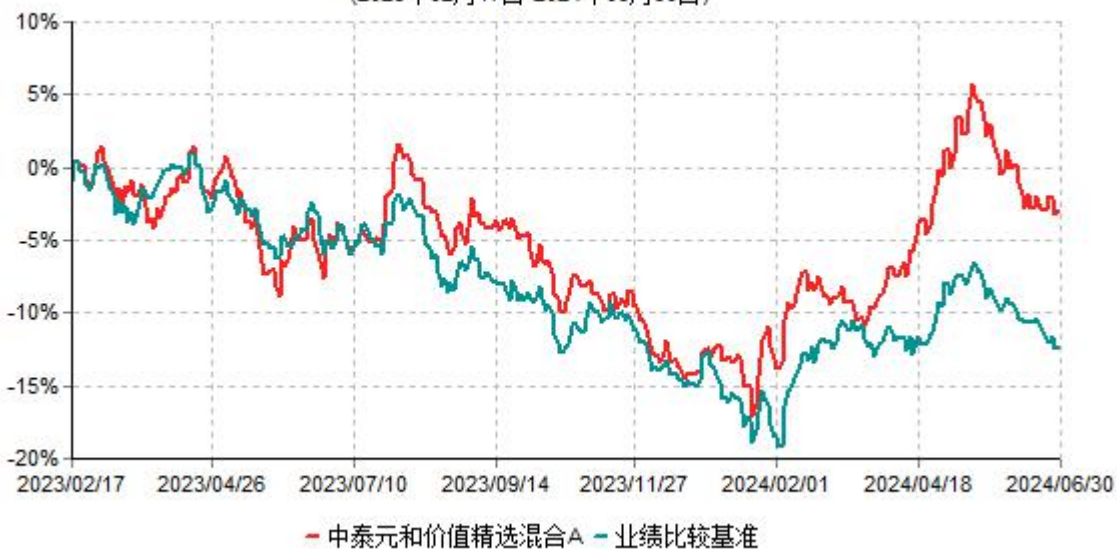
中泰元和价值精选混合A累计净值增长率与业绩比较基准收益率历史走势对比图 (2023年02月17日-2024年06月30日)