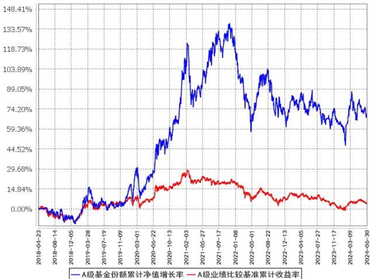
A级基金份额累计净值增长率与同期业绩比较基准收益率的历史走势对比图 (2018年4月23日至2024年6月30日)