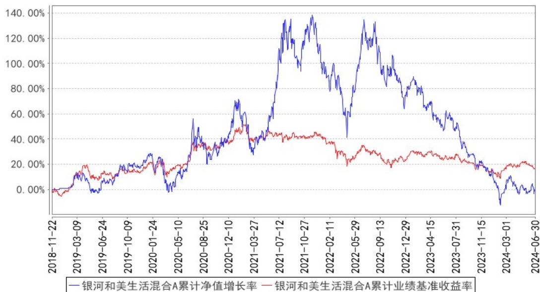
银河和美生活混合A累计净值增长率与同期业绩比较基准收益率的历史走势对比图