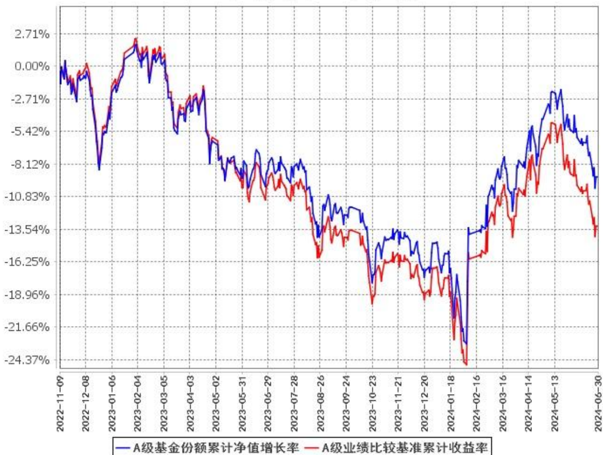
A级基金份额累计净值增长率与同期业绩比较基准收益率的历史走势对比图 (2022年11月9日至2024年6月30日)