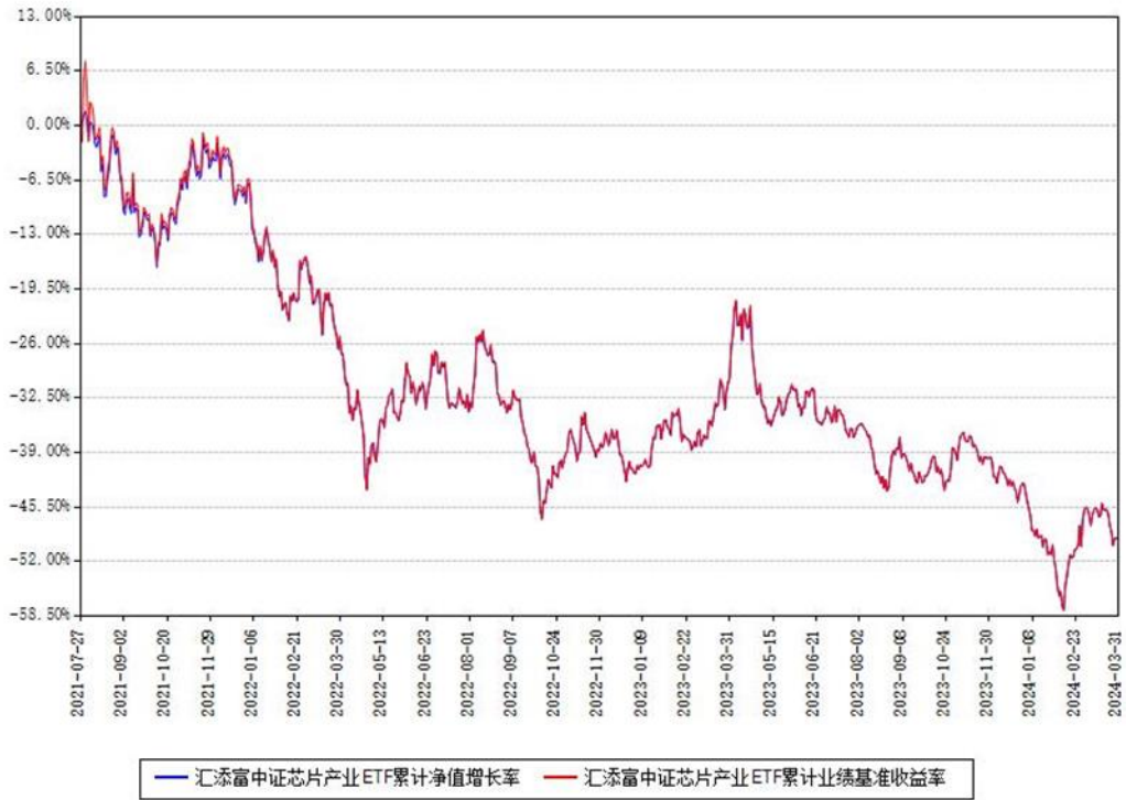
汇添富中证芯片产业ETF累计净值增长率与同期业绩基准收益率对比图