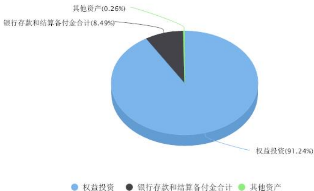
投资组合资产配置图表 数据截止日期:2023年09月30日