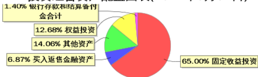
投资组合资产配置图表(2024年3月31日)