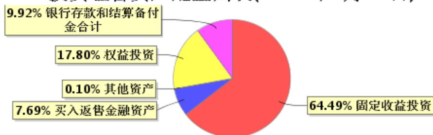
投资组合资产配置图表(2024年3月31日)

● 固定收益投资 ● 买入返售金融资产 ● 其他资产 ● 权益投资 ● 银行存款和结算备付金合计