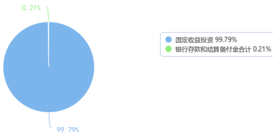
投资组合资产配置图表（数据截至日期：2024年03月31日）