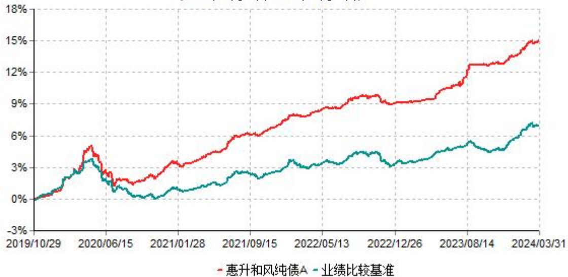
惠升和风纯债A累计净值增长率与业绩比较基准收益率历史走势对比图 (2019年10月29日-2024年03月31日)

2、自基金合同生效以来基金累计净值增长率变动及其与同期业绩比较基准收益率变动的比较