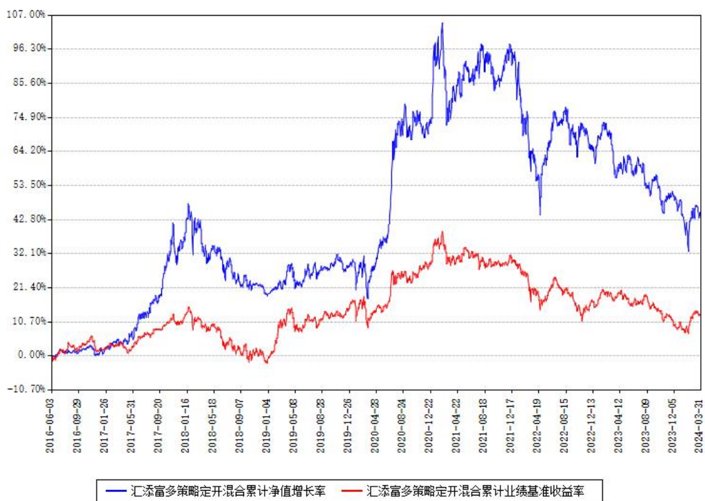
汇添富多策略定开混合累计净值增长率与同期业绩基准收益率对比图