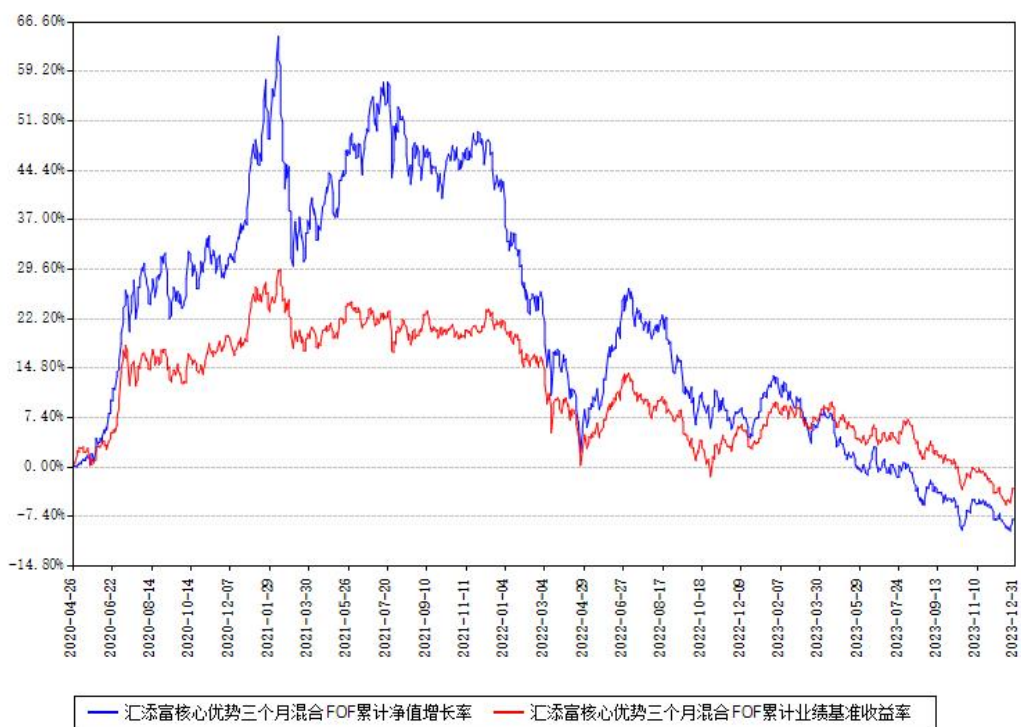
汇添富核心优势三个月混合FOF累计净值增长率与同期业绩基准收益率对比图