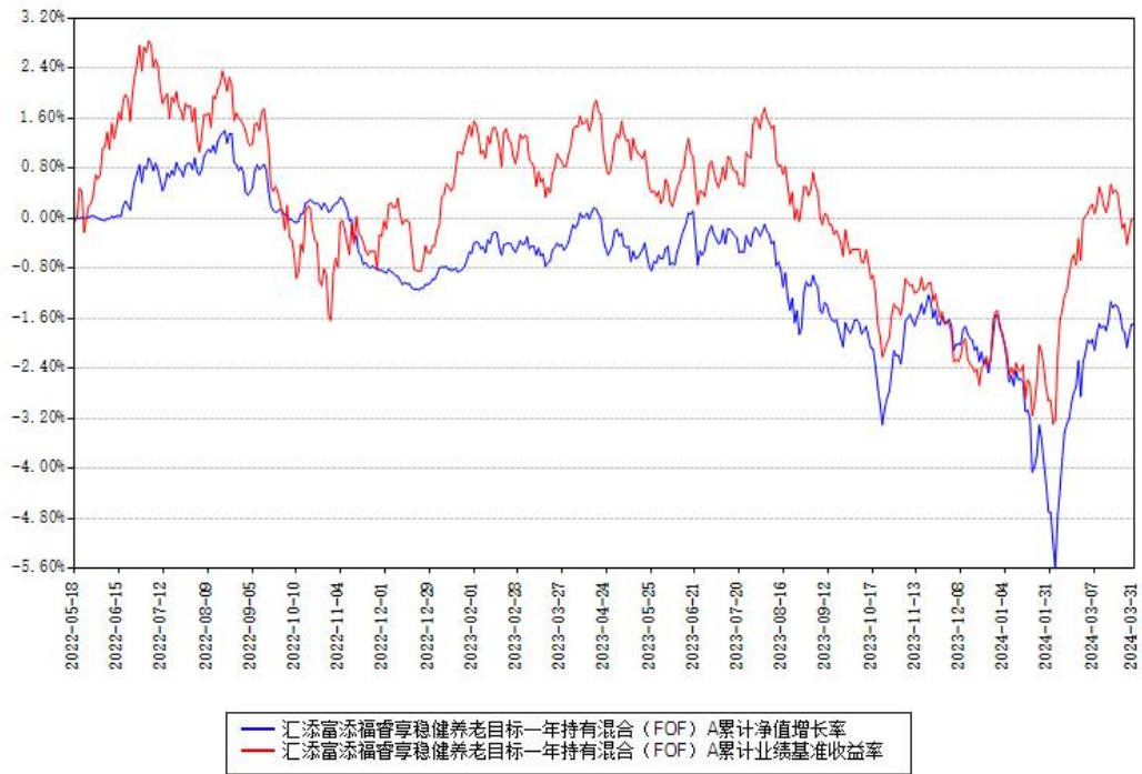
汇添富添福睿享稳健养老目标一年持有混合（FOF）A累计净值增长率与同期业绩基准收益率对比图