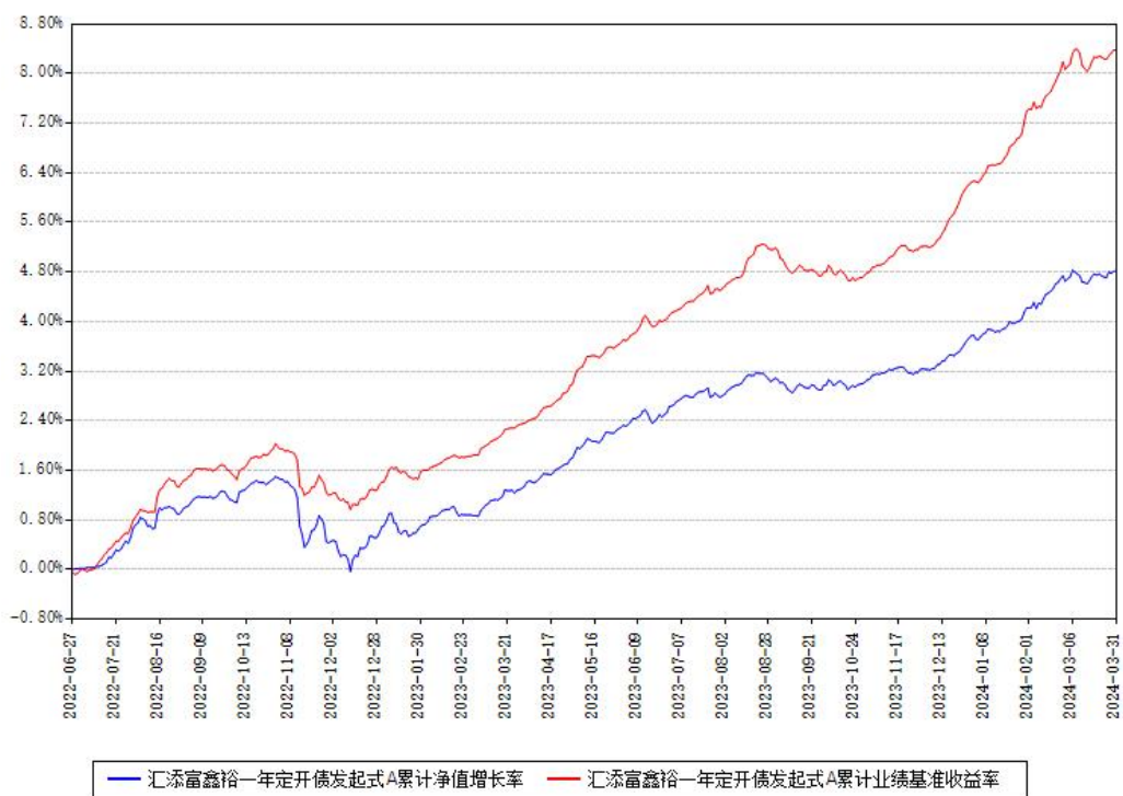
汇添富鑫裕一年定开债发起式A累计净值增长率与同期业绩基准收益率对比图