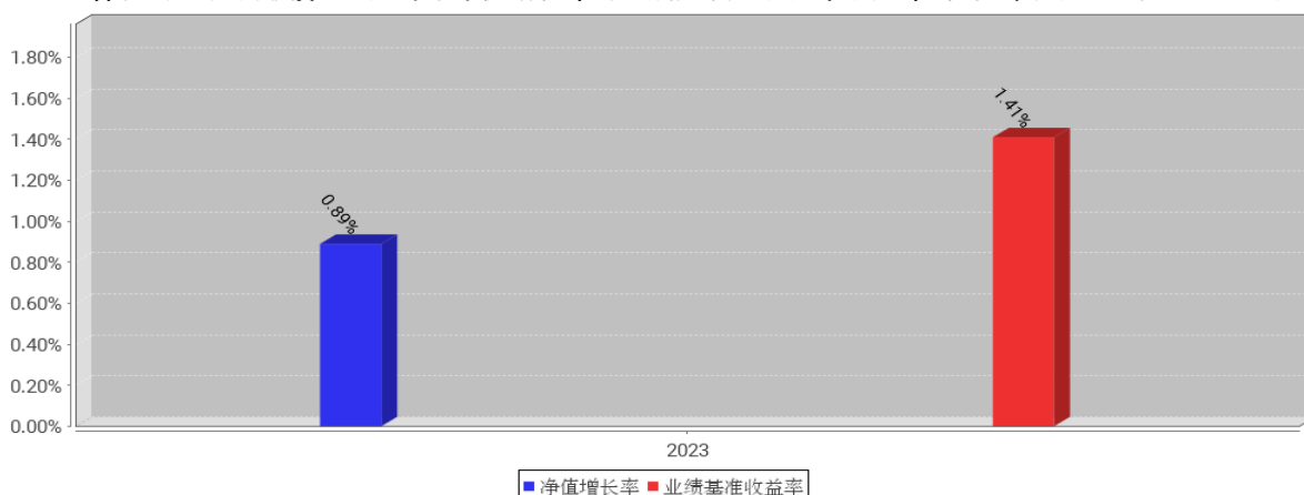
工银瑞宁3个月定开债券A基金每年净值增长率与同期业绩比较基准收益率的对比图（2023年12月31日）

注：1、本基金基金合同于2023年9月26日生效。合同生效当年不满完整自然年度的，按实际期限计算净值增长率。