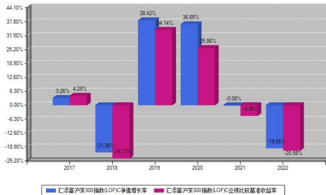
汇添富沪深300指数(LOF)C每年净值增长率与同期业绩基准收益率对比图

注：数据截止日期为2022年12月31日，基金的过往业绩不代表未来表现。本《基金合同》生效之日为2017年09月06日，合同生效当年按实际存续期计算，不按整个自然年度进行折算。